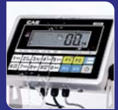
IP67 방수 로드셀 및 스테인레스 스틸 인디케이터