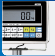
간편하고 쉬운 작동법 & 충전식 배터리 장착