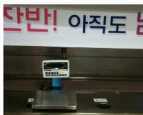
잔반 저울 정부기관 납품사례