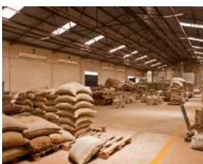
농가 수확물 유통분야