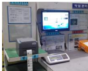
주문형 배합저울 납품사례