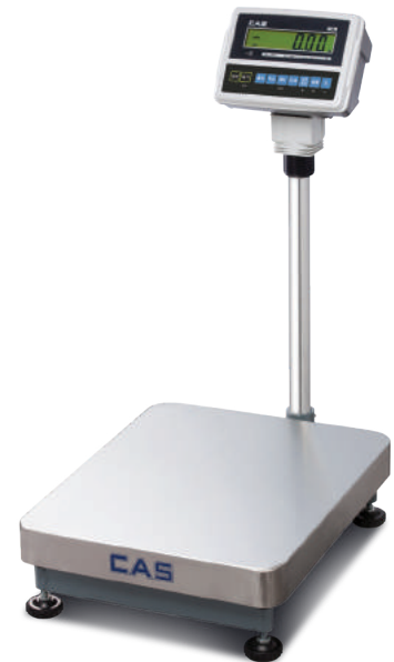
옵션 : 티켓프린터(DEP-50), 라벨프린터(DLP-50)