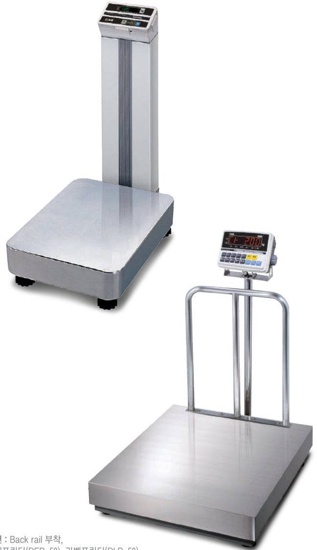
옵션 : Back rail 부착, 티켓프린터(DEP-50), 라벨프린터(DLP-50)