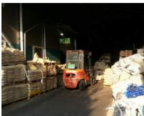
제조업체 ECB 납품사례