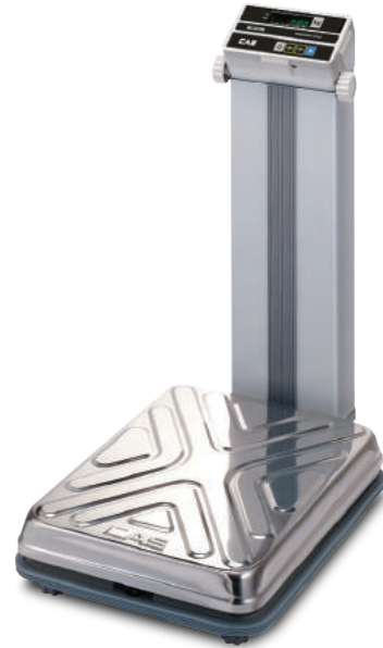
옵션 : RS-232C 인터페이스(PC/프린터 연결)