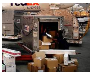
배송 관리 분야