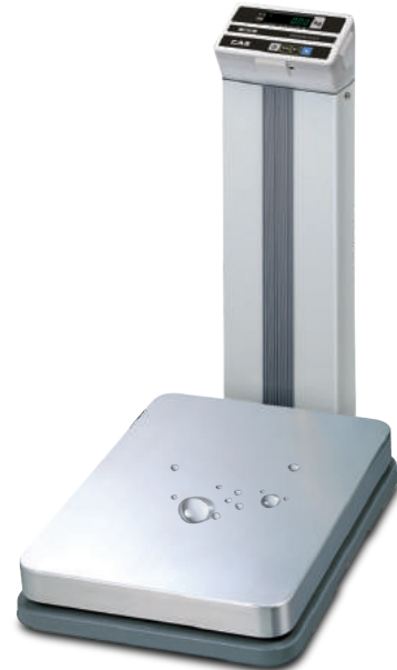
옵션 : 티켓프린터(DEP-50)