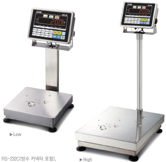
옵션 : RS-232C(방수 커넥터 포함), 티켓프린터(DEP-50), 라벨프린터(DLP-50)