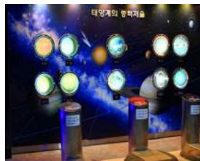
주문형 벤치저울 납품사례-행성별 중력비교