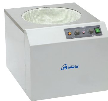
ESB 308, ESB 309