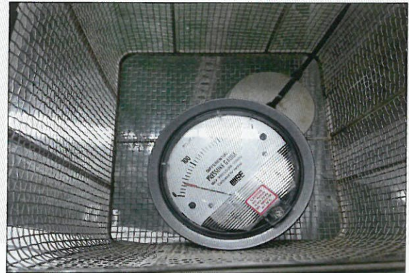
[그림 4: IP X7]