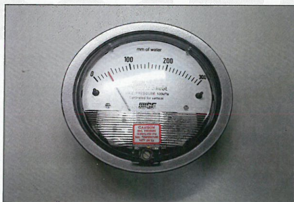
[그림 1: 전면]